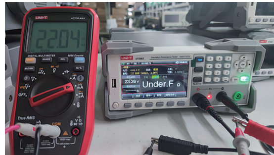
>20mA充电电流,测试充电更快速